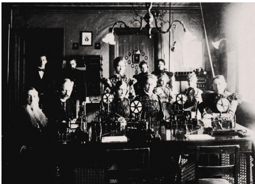
Bilde fra Skien telegrafstasjon i 1898.