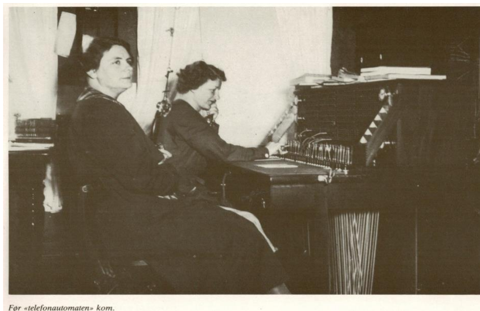
1900 tallets utgave at telegrafstasjon som ble betjent av pene damer som her i Langesund. «De har «Feset» i boks 2».