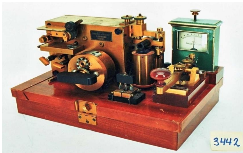
Komplett elektrisk telegraf fra slutten av 1800 tallet.

Referatet i protokollen fra 1882 gjengis i sin helhet og i original, dog med noe tilpasning til noe mer moderne språkform for å lette forståelsen og lesningen. Litt blanding av gammelt norsk og litt moderne språk er dog tatt med.